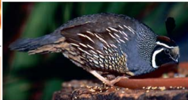
(1,0) przepiór kalifornijski Callipepla californica (Mnichow '03 r.)

Występuje na obszarach zachodniej Ameryki Północnej, ciągnących się od