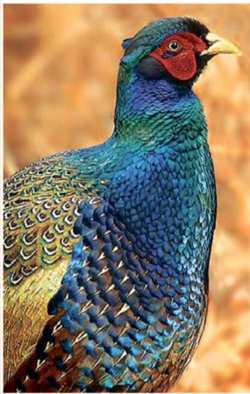
(1,0) bażant pstry Phasianus versicolor