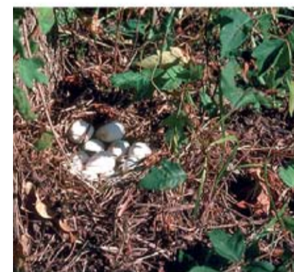
onymi w jednym miejscu, przez samicę perlinus virginianus )

ją w jednoej jest do- tu i ukryty duża szan- Gdy niosą nie popad- wanie jest y przerna- dkami lub je codzien- omieszcze- C. Niższa